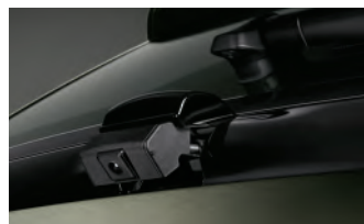
Caméra de recul