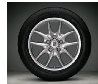
Jantes « Cayenne Design » 19 pouces