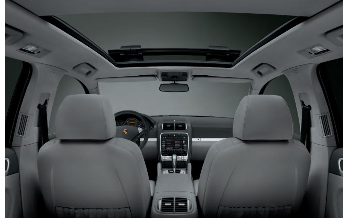
Système de toit panoramique