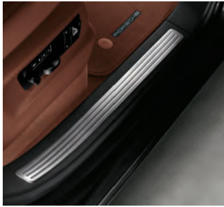
Pack Mémoire Confort avec baguettes de seuil de porte en acier spécial