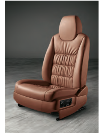
Sièges en cuir souple