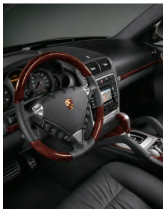
Pack bois Ronce de Noyer, foncé (finition brillante)