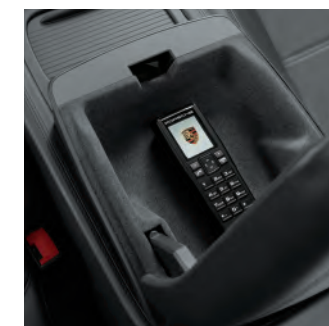
Module de téléphone avec combiné sans fil