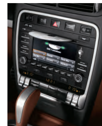
Porsche Communication Management (PCM) avec chargeur 6 CD/DVD