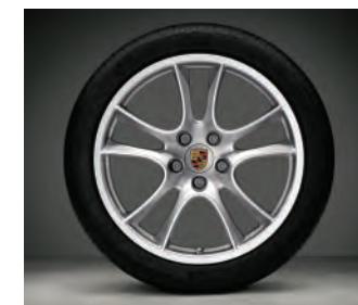
Jantes « Cayenne Sport » 21 pouces