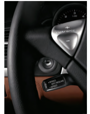
Régulateur de vitesse Tempostat