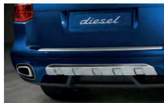
Cartier de protection arrière en acier spécial

Vous trouverez des informations détaillées sur l'ensemble des équipements disponibles pour le Cayenne Diesel dans les tarifs Cayenne Diesel, ainsi que dans le catalogue Cayenne ou encore auprès du Réseau Officiel Porsche. Les autres options de personnalisation ainsi que les accessoires sont présentés dans les catalogues Exclusive Cayenne et Tequipment Cayenne.