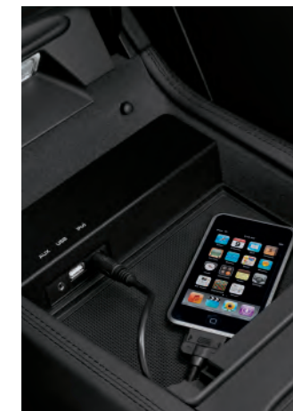
Interface audio universelle (iPod®, USB, AUX)

○ Option • Équipement de série G Option gratuite