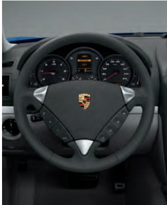
Volant multifonction à 3 branches avec commandes Tiptronic S au volant