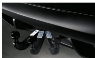
Dispositif d'attelage rétractable électriquement