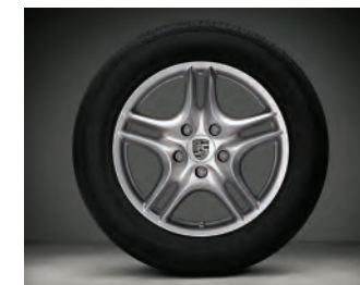
Jantes « Cayenne Turbo II » 18 pouces

○ Option • Équipement de série G Option gratuite Pour les explications des notes de bas de page, reportez-vous à la page 23.