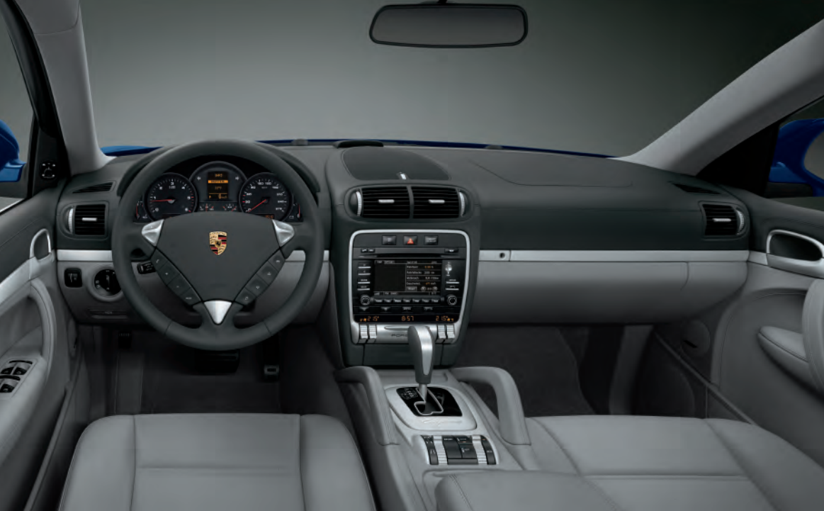
Cockpit du nouveau Cayenne Diesel doté du Pack Aluminium « Sport »