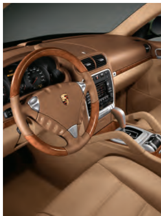
Pack bois Olive, clair