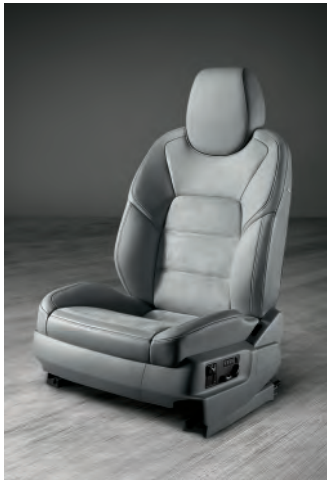
Siège sport avec Pack Mémoire Confort