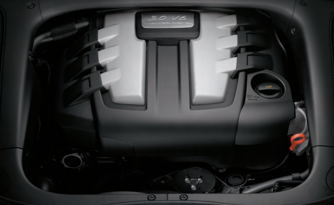
Le moteur V6 turbo diesel de 3,0 litres

Le système refroidi de recyclage des gaz d'échappement du moteur V6 turbo diesel de 3,0 litres de cylindrée renvoie une partie des gaz d'échappement vers le moteur. Résultat : une baisse de la température de combustion et une réduction des émissions d'oxydes d'azote. La présence du catalyseur à oxydation est une évidence, tout comme celle du filtre à particules. Et comme une évidence ne vient jamais seule : le nouveau Cayenne Diesel satisfait aux exigences de la