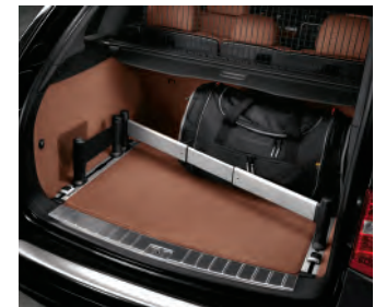
Pack aménagement du coffre