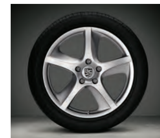
Jantes « Cayenne SportTechno » 20 pouces